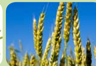
Oil z pšeničných klíčků