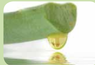
Aloe Vera extrakt

Ze všech aktivních látek, které používáme k výrobě našich přírodních produktů, jsme schopni získávat nejdůležitější organické složky z vlastního ekologického zemědělství! O které suroviny se jedná?